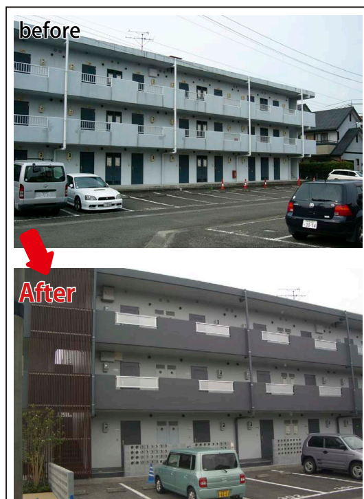
※写真は静岡市の物件サイレント24です