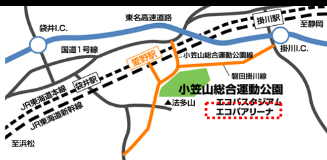
東名高速袋井I.C.より約14分、掛川I.C.より約8分