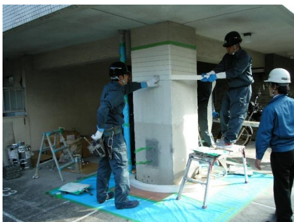
低コスト・短工期のSRF工法(包帯補強)