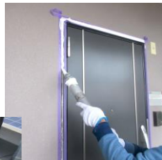
↑ シーリング 防水